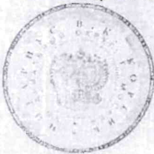
В. К. Корсик

Уплачено за совершение нотариального действия: 11 000 руб. 00 коп.